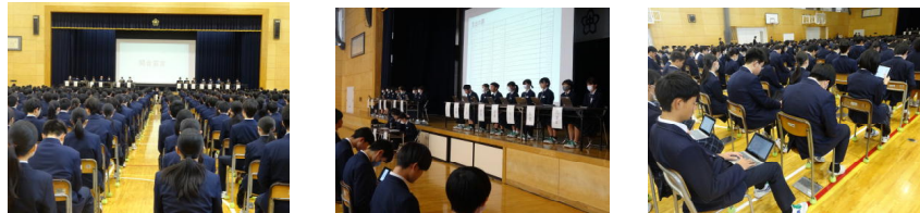
←資料はタブレットの中に。各自タブレットを持って参加しました。